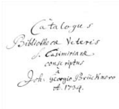
Ms Cas 1 Katalog der Bibliotheca Casimiriana